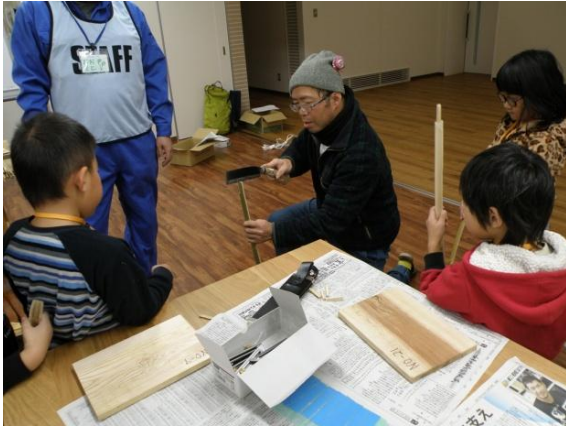
ナタを使って慎重に割ります