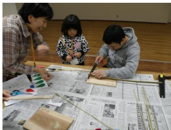
難しいところはお父さんの腕の見せ所