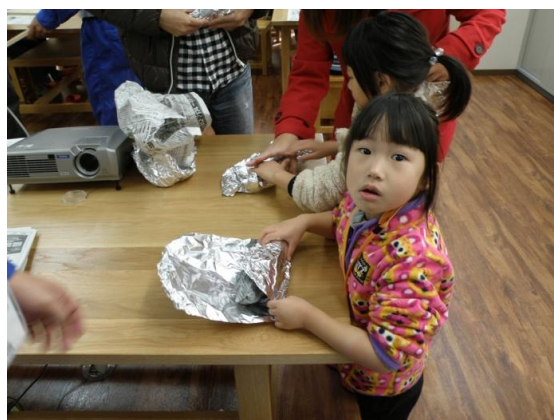
新聞紙で包んで焼き芋準備完了！