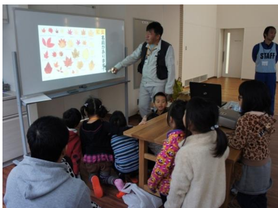
紅葉について学びます

雨が降っていたため、里山の中でフィールドアーチェリーをすることができなかったのが残念ですが、貴重な体験をすることができた1日となりました。