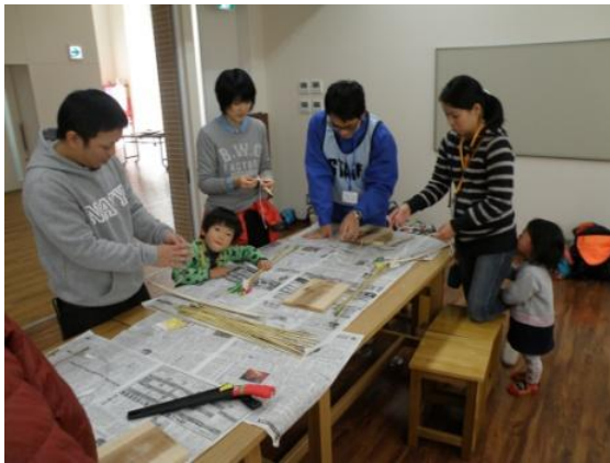
紐の結び方が意外と難しい…^^;