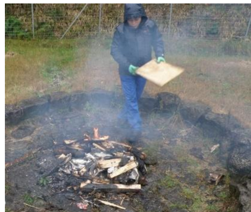
この間スタッフは雨との戦い…