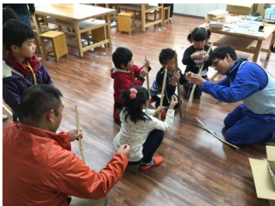
紐をかけて準備完了