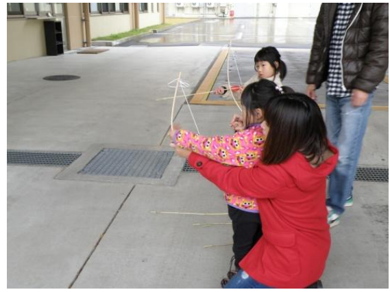
上手に飛ばせるかな？