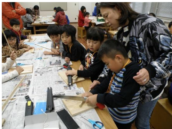
まずは竹を切っていきます