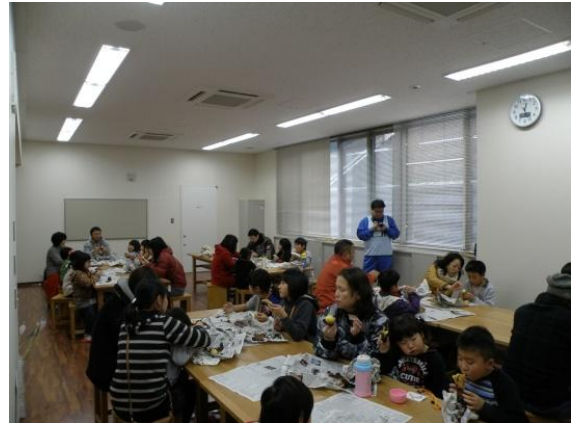
最後は皆で焼き芋試食タイム☆