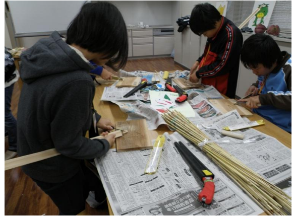
削って形を整えていきます