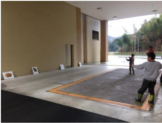
狙いを定めて力強く飛ばします