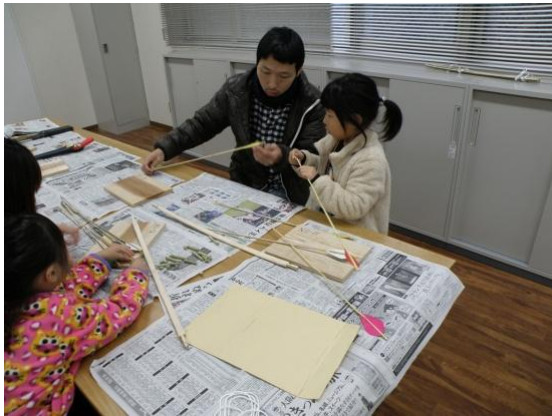
矢羽をつけて弓矢を作ります