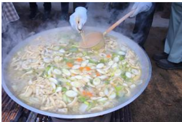
いも煮も完成間近！