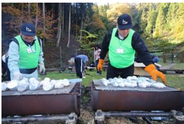
焼き具合はスタッフに任せて竹工作の始まりです