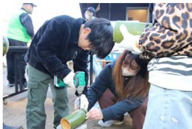
電動工具も使います