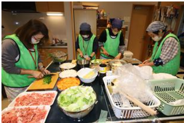
スタッフはいも煮の準備に大忙し！