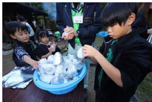
焼きいもの準備ができました