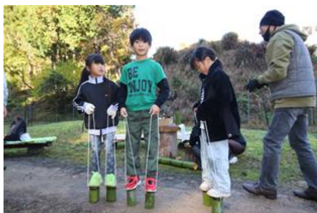
竹ぼっくりの完成です