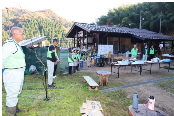
焚火を囲んで「はじめの会」です