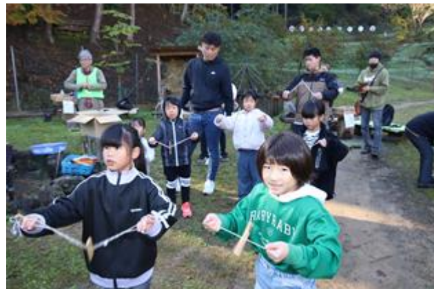
ぶんぶんゴマもできまし